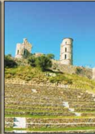
Théâtre de plein-air

Témoin de l'histoire du village, le château est classé monument historique depuis 1928.