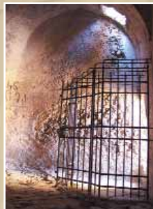
La citerne du château