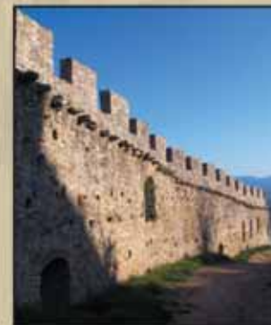
Tour du XIII e siècle